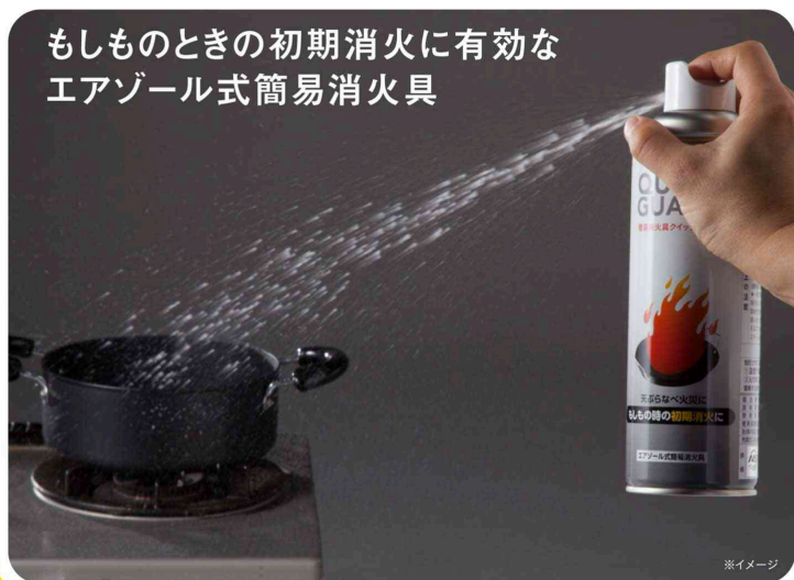
もしものときの初期消火に有効な エアゾール式簡易消火具

火元に向かって スプレーするだけで 消火ができる 便利なアイテムです。 すぐに使える 身近な場所に 置いておくだけで 安心感が 生まれます。