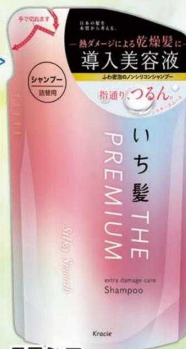
クラシエ いち髪プレミアム ■シャンプー 340ml ■トリートメント 340g 各種 (つめ替)