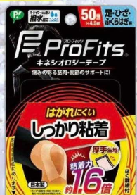
ピップ プロ・フィット キネシオロジーテープしっかり粘着 ■幅37.5mm 肩・腕・手首用 ■幅50mm 足・ひざ・ふくらはぎ用