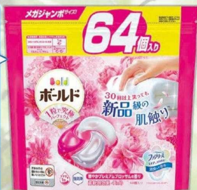
P&G ボールド ジェルボール 4in1 各種 (つめ替) メガジャンボ

ジェルボールは、配合されている水の量を85%ほど抑えることで、節水まの洗いにも最適。なので、洗濯回数を減らし、節水や節電にも!