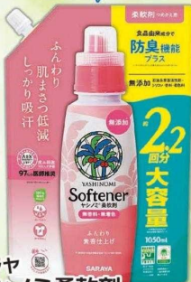
サラヤ ヤシノミ柔軟剤 (つめ替) 1050 ml