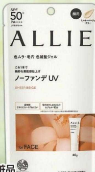
カネボウ化粧品 アリー クロノビューティ カラーチューニングUV 各種 40g